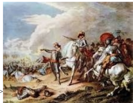
malerier fra den tiden>

Han var en hårdet forkæmper uden den mindste frygt og jeg fornemmede hans talrige kampe, alle ført med den muntreste hensynsløshed, og som om de havde kun lige sket. Det var ret overvældende, og jeg gik rundt for at inspicere våbenvognen, som jeg var nysgerrig efter at se, hvordan den sammenlignes med vores i den første verdenskrig. Det var rå og simpelt med tunge jernbeslag, og da jeg rørte ved et af hjulene, så jeg ud til vidne til hele borgerkrigen (1642>).