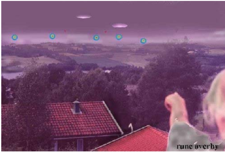
Ill. over av datalaget av rune overby i forb.med at jeg intervjuet Liv Se http://galactic.no/rune/livhofos.htm