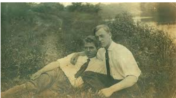
photo n'est pas accidentel et sur l'autre côté-« père et fils » avoir l'air à partir de « même âge » lorsque l'avoir été par le biais de la phase de nettoyage. Plus d'infos sur elle dans le

Quand notre émotion se fut un peu calmée, nous parlâmes de celle dont l'amour m'avait accompagné sur la voie vers les hauteurs. J'appris alors que c'était mon père qui avait veillé sur nous, qu'il nous avait aidés et protégés. Il m'avait suivi dans mes déplacements dans le monde des esprits et, durant mes combats, m'avait protégé et consolé. Caché certes à ma vue, il avait toujours été cependant près de moi, infatigablement et dans un amour secourable. Tandis que je me morfondais à la pensée d'une rencontre avec lui, il était là, attendant une occasion de se manifester. Il était parvenu à établir une liaison grâce à celle avec qui, par mon amour, j'étais en si étroit contact, et, par la joie des retrouvailles, à nous amener à des relations encore plus intimes.