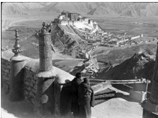
t.v; fra en Logsar festival Tibet og t.h. utsikten fra taket på klosteret som Rampa forteller om her.

På taket som var mitt favorittsted, var alt stille. Solen ga bare en svak varme nå. Under meg, ute av syne, hørtes murringen fra folkemengdene, en murring som i sin ubestemthet, beroliget meg og gjorde meg trett i middagstidens varme. En mystisk karakter materialiserte seg nesten helt - på grensen for min synssans. Søvnig ristet jeg hodet og blunket. Da jeg igjen åpnet øynene helt, var den der fremdeles; klarere nå og glødende, tettere. Hårene på bakhodet ble stive av skrekk. "Du er vel ikke et spøkelse!" utbrøt jeg. "Hvem er du?"