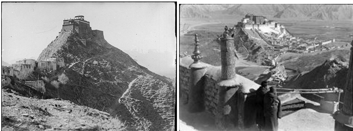
bildet t.h. er tatt fra dette Chakpori klosteret, Lobsang Rampas 'hjem' - dvs. nærbilde/utsikten derfra t.h. imot Potala. Chakpori klostere, t.v, ble ødelagt av kineserne i -59 da de invaderte Lhasa.