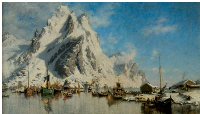
bilde fra Lofoten- malt i 1887 – ukjent kunstner – altså omtrent på den tiden denne bok ble skrevet (utgitt 1904 oppr.)

»Men Herren, som er den evige kærlighed, vil ikke lade nogen sjæl forgå eller pines i endeløse tider. Smerten er det nødvendige redningsmiddel for den urene ånd. »Alt offer må saltes med ild«, alle synder sones med lidelse. Den, som går med stridigt sind til straffens velsignelse, forsinker og vanskeliggør sin genfødsel, mens den, som med taknemmelighed for den guddommelige kærlighed, med tiltro til den guddommelige retfærdighed styrter sig ind i renselsesilden, hurtigt vil udgå derfra frigjort og lutret for at begynde et nyt liv, bestandigt stigende opad i stadig klarere lys, i bestandig renere skønhed.«