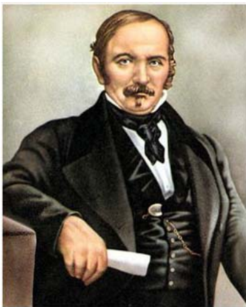
Allan Kardec (1804 – 1869)

tiders religiøse og filosofiske anskuelser. Måtte enhver prøve dem både med fornuft og hjerte og kontrollere, i hvilken grad de tilfredsstillter hans krav til en retfærdig og kærlighedsbestemt verdensstyrelse