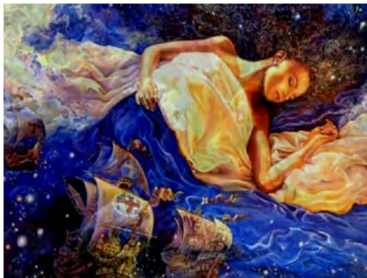
søvn er egentlig astralkroppens frigjørelse og "den lille død"