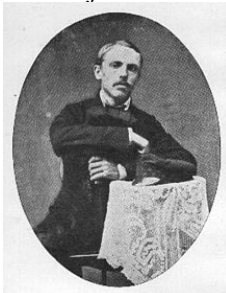
*) Viktor Rydberg (billedet) Fortalen til „Asiens Ljus“.

da naturligere, end at vi er forpligtet til at hjælpe hinanden, så langt vore kræfter rækker. Det er en aftjening af den gæld, vi har til hele menneskeheden for de fejl, vi har begået, eller for forsømmelsen af at gøre, hvad vi havde kunnet gøre. Det er ved selvopofrelse og barmhjertighed, at samfundet efterhånden skal oprejses fra den bedrøvelige stilling, hvortil det er blevet draget ned gennem selviskhed og undertrykkelse. Det er derved, at "kampen for tilværelsen skal forvandles til det af visdommen ledede og af medfølelsen lettede samarbejde for tilværelsen».*)