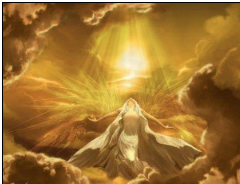
surrendering to the Light (source unknown)

Lad os i ydmyghed håbe, at vi med bibeholdelse af individualiteten går til en genforening med Gud.