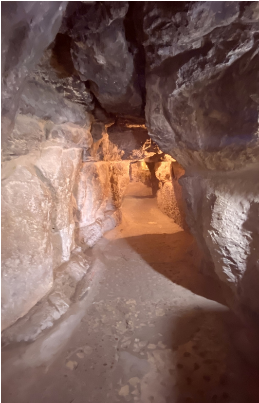
Røver – indgangen'