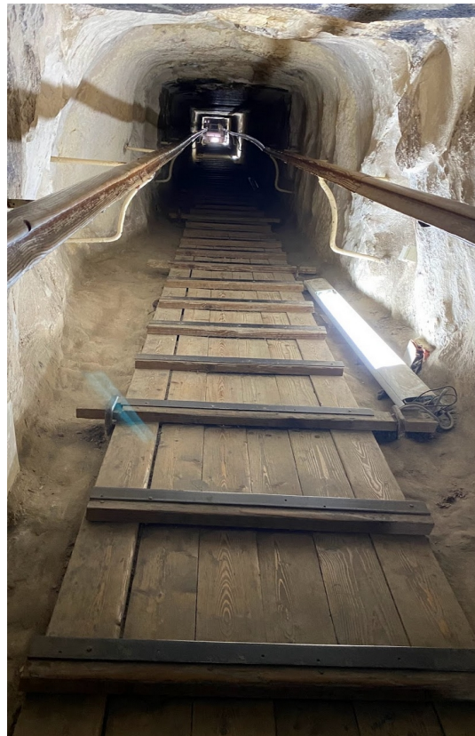
Den opstigende gang