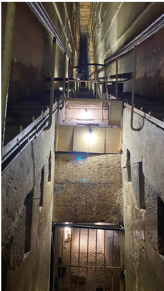
Et kig op i 'Det Store Galleri' – Underst ses indgangen til Dronninge-kammeret