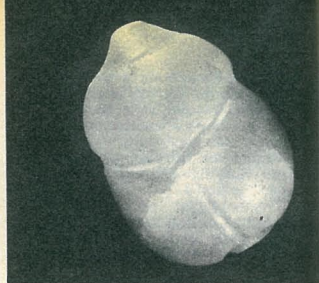
Är detta ett föremål från en avlägsen främmande värld? Från början en kvartsstav, nu omslipad till skarabé.

Pollenkungen avslöjar sin 25-åriga hemlighet: